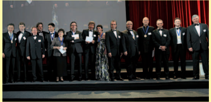
Die Gold-Gewinner des Sappi European Printers of the Year Awards.